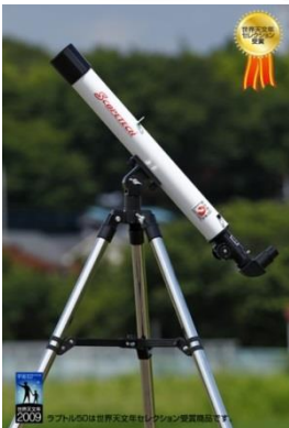
ラプトル50天体望遠鏡

本や手帳のしおりとして必要な箇所をブックマークできるしおりクリップと3倍率のルーペ・拡大鏡などの多機能な選定規です。